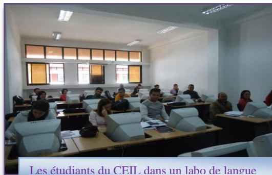
Les étudiants du CEIL, dans un labo de langue

Depuis le lancement du CEIL en mai 2009, l'équipe en charge de lancer les formations en langue n'a ménagé aucun effort pour réussir la mission qui lui a été confiée.