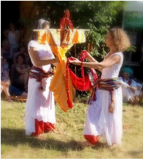
Le rite d'Anzar