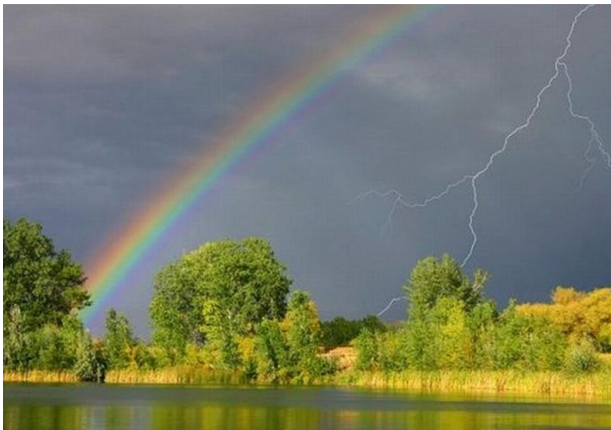
La fiancée d'Anzar