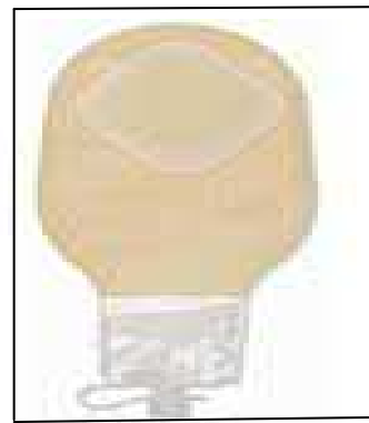
Figure n°5 : Représentation d'une poche vidable.

On note que dans les colostomies gauches, les selles sont solides et peu abondantes, des poches fermées sont le plus souvent, employées. Elles sont toujours dotées d'un filtre désodorisant, afin d'éliminer gaz et odeurs.