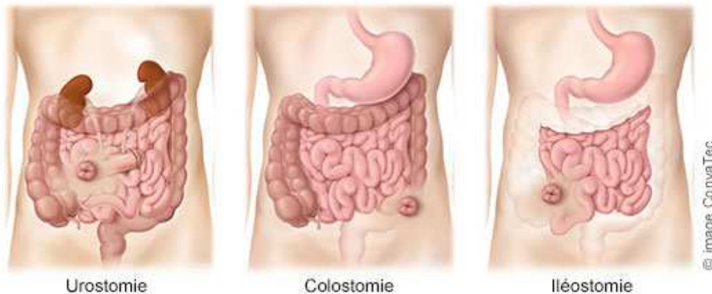
Figure n°1 : Représentation des types de stomie

Ils existent trois types de stomie : l'urostomie, la colostomie et l'iléostomie