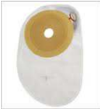
Figure n°4 : Représentation d'une poche fermée.

Les poches de recueil existent en deux versions : fermée ou vidables