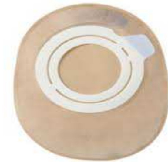
Figure n°2 : Représentation du système « une pièce ».

-Les premiers sont des systèmes dits « une pièce ». Dans ces dispositifs, le support protecteur est solidaire de la poche. L'ensemble est décollé à chaque changement de poche. L'ensemble est décollé à chaque changement de poche.