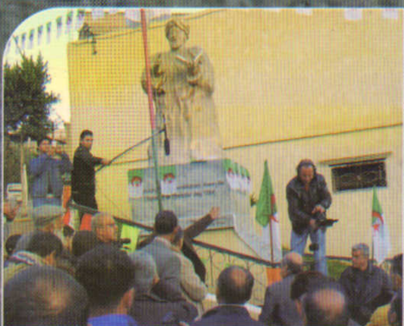
Inauguration de la stèle ABDERAHMANE AWAGHLIS