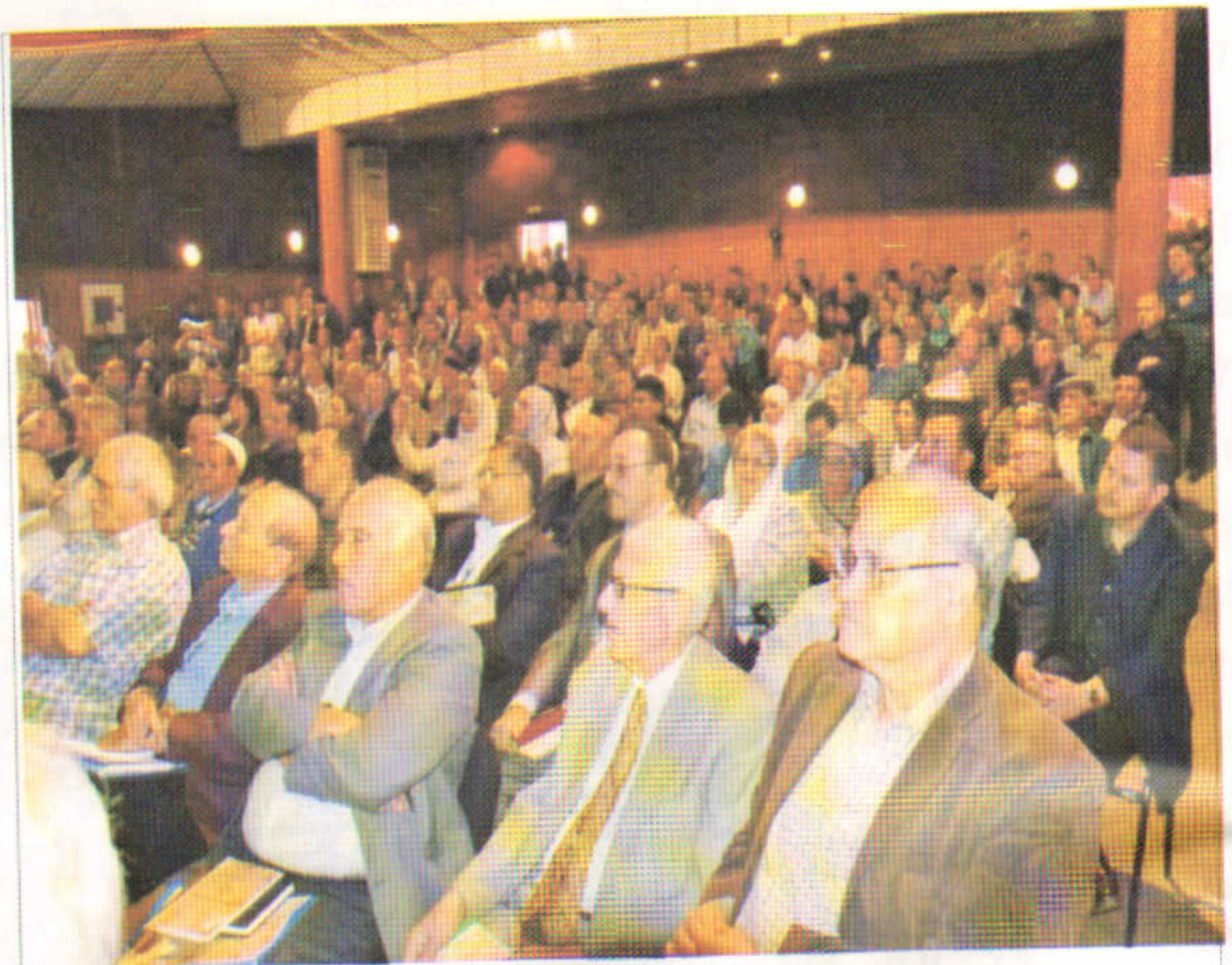
Plus de vingt conférenciers de haut niveau, venus de toutes les régions du pays et de l'étranger ont animé le Colloque sur Mohand Chérif Sahli