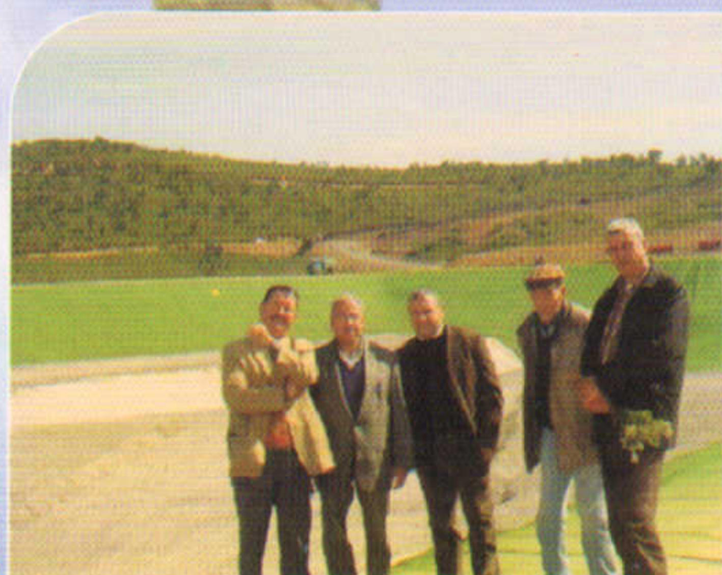
Un CET, une perspective pour l'environnement et le développement

ANSUF YES-WEN FER TTIWANT N TNEBDAR بلدية تينبدار ترحب بكم LA COMMUNE DE TINEBDAR VOUS SOUHAITE LA BIENVENUE