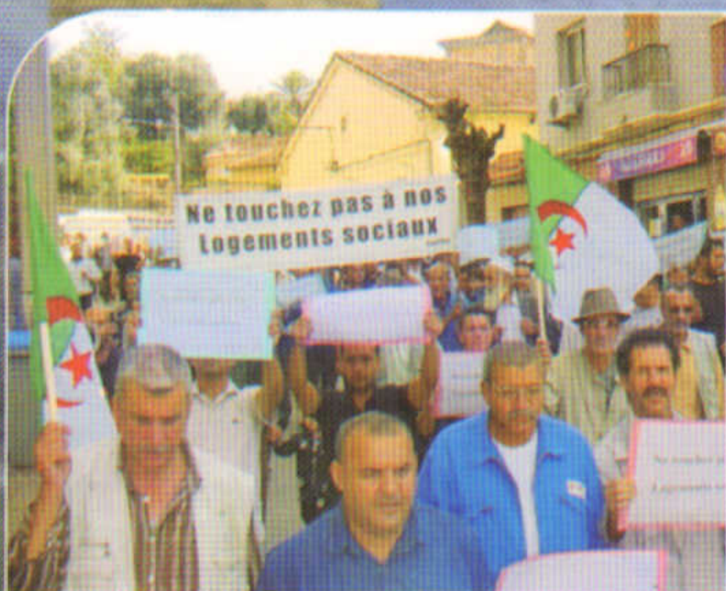
Citoyenneté en marche

La commune de Tinebdar, est l'histoire d'un combat quotidien d'hommes et de femmes pour le développement