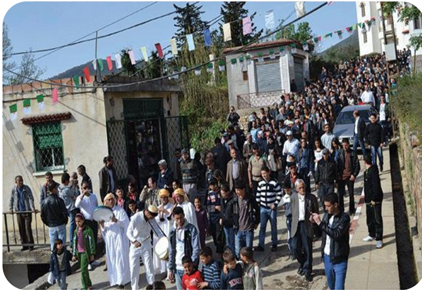
Sixième édition de la Fête de l'eau le 21 Mars 2015