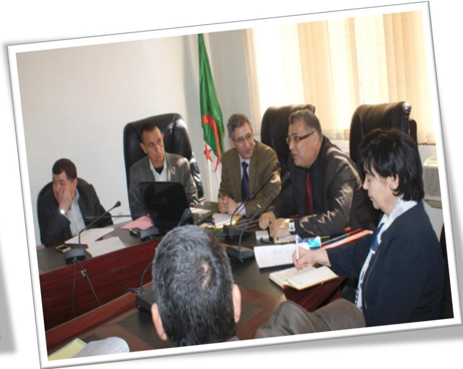
Lancement du projet “The TRUST by DANONE”, le 15 Juin 2015