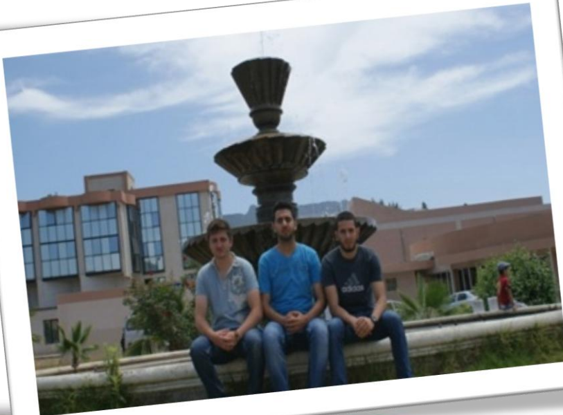
Candidats retenus dans le cadre du Programme FATIMA AL FIHRI 2015/2016