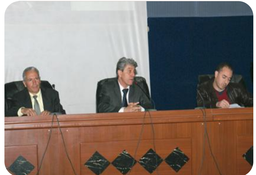
Journée d'information sur la Maison de l'Entrepreneuriat Le 08 Avril 2014