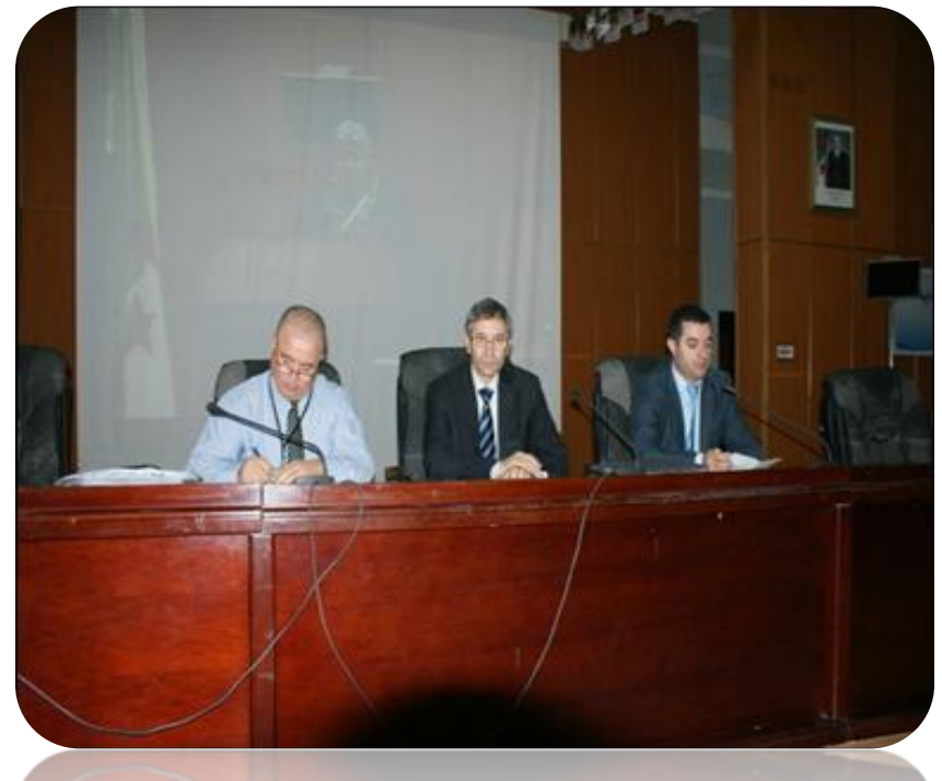
Rencontre Internationale sur la Révolution Numérique: Enjeux et Perspectives dans l'Apprentissage et l'Enseignement des langues Les 18 et 19 Novembre 2014