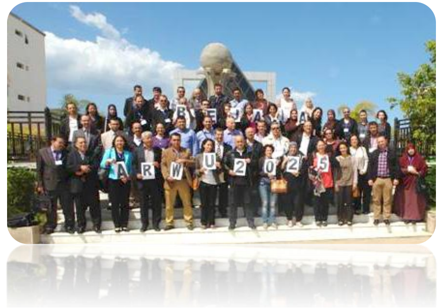
Séminaire pédagogique intitulée Cinq Clés en Main du 25 au 27 Avril 2015