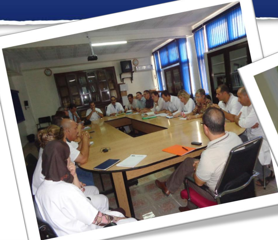
Coopération Scientifique Béjaïa & Saint-Etienne, du 14 au 19 Octobre 2014