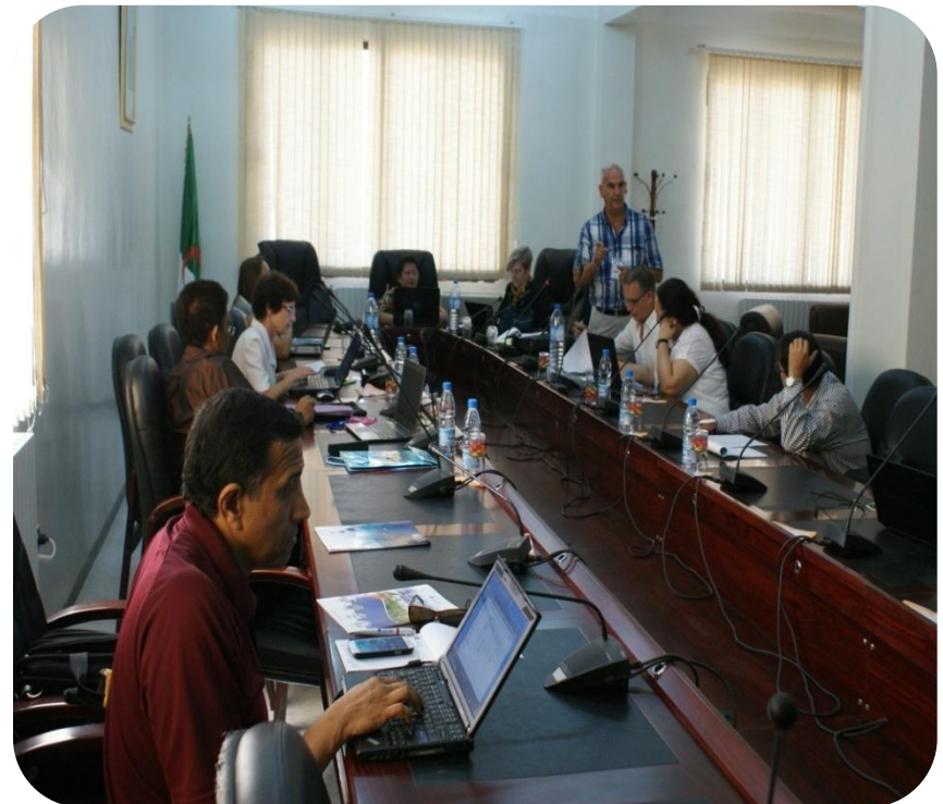
Rencontre Internationale des Experts sur le Projet de Recherche Coordonné (PRC) intitulé « l'application de la technologie des rayonnements dans l'élaboration de matériaux d'emballage avancés pour les produits alimentaires » Du 08 au 12 Septembre 2014