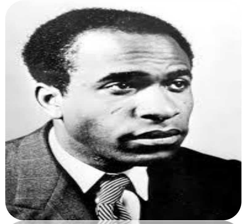
Colloque international sur Frantz Fanon, la révolution Algérienne et l'interdisciplinaire Les 26 et 27 Mai 2015