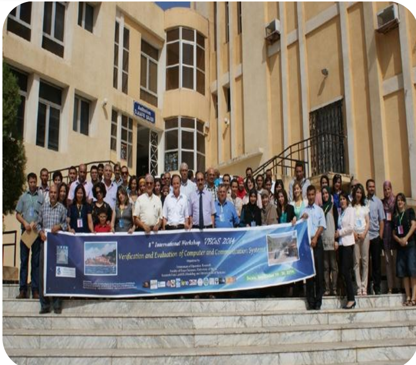
Workshop International sur la vérification et l'évaluation des systèmes informatiques et de communication les 29 et 30 Septembre 2014