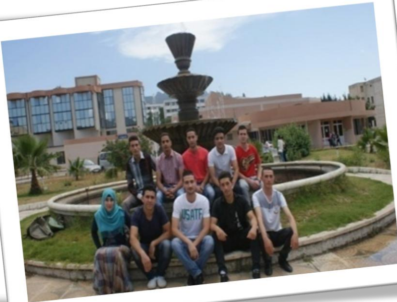
Candidats retenus dans le cadre du Programme Green IT 2015/2016