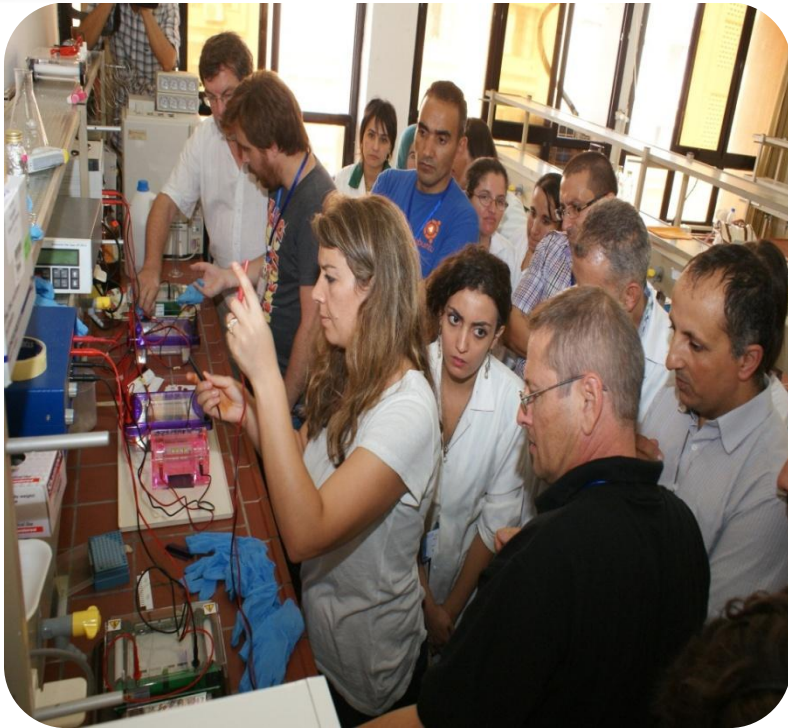
Workshop de Biologie Moléculaire et Phylogénie du 12 au 14 Octobre 2014