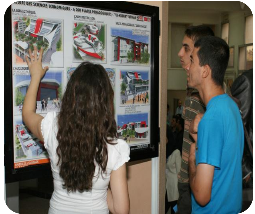
Rencontres Nationales sur le Génie Civil (RNGC'2014) les 22 et 23 Octobre 2014