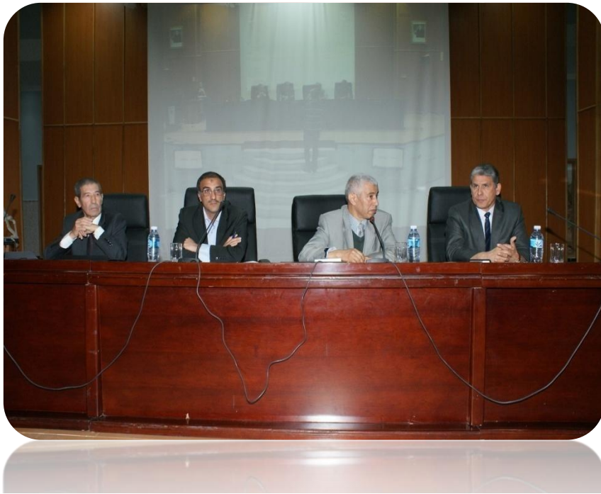
Journée d'études sur l'organisation et le fonctionnement des laboratoires de recherche le 18 Avril 2015