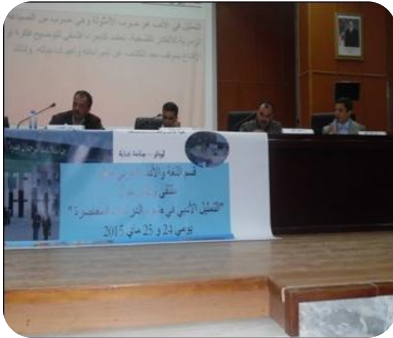
ملتقى وطني حول التمثيل الأدبي في ضوء الدراسات المعاصرة يومي 24 و 25 ماي 2015