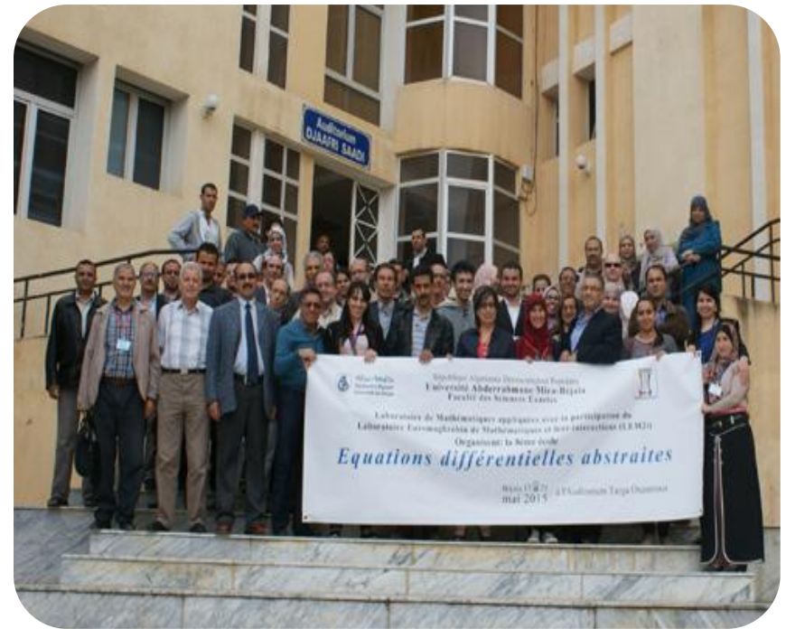
8 ème École “Équations Différentielles Abstraites” Du 17 au 21 Mai 20