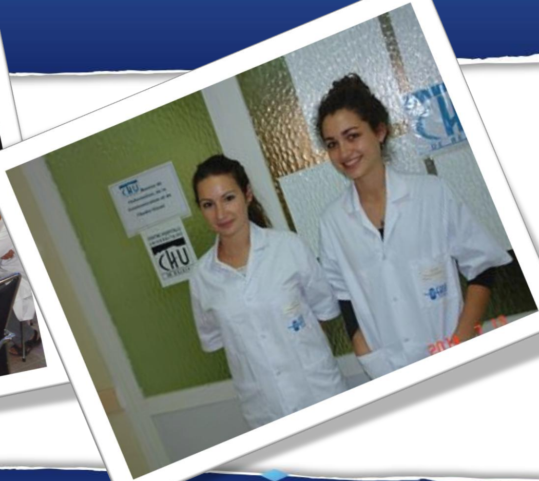
Etudiantes de l'Université de Brest en stage à Béjaïa du 14/07/2014 au 22/08/2014