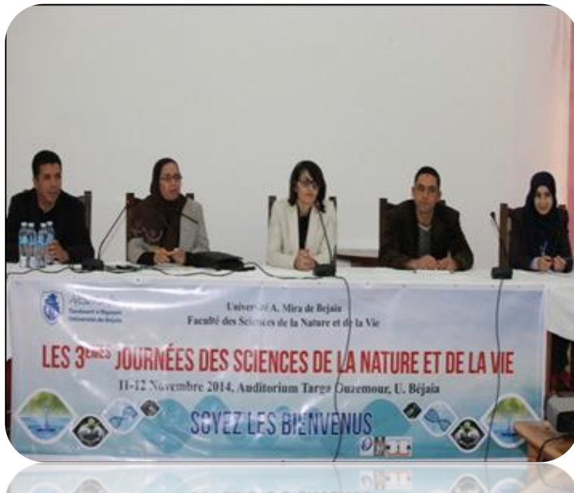
Les 3 èmes journées des Sciences de la Nature et de la Vie Les 11 et 12 Novembre 2014