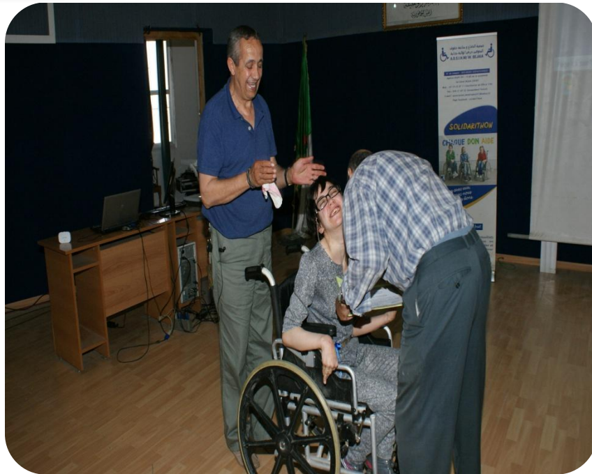
Journée d'études sur les personnes en situation d'handicap, l'informatique et l'accessibilité Le 11 Mai 2015