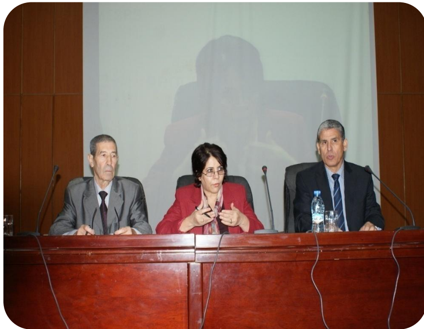
Journée d'études sur les Règles de la Comptabilité Publique et la Réglementation des Marchés Publics Le 25 Décembre 2014