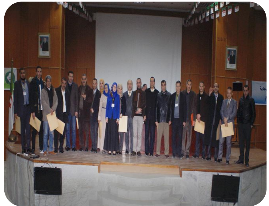
Colloque national sur le mouvement syndical en Algérie pendant la période coloniale Le 11 Mars 2015