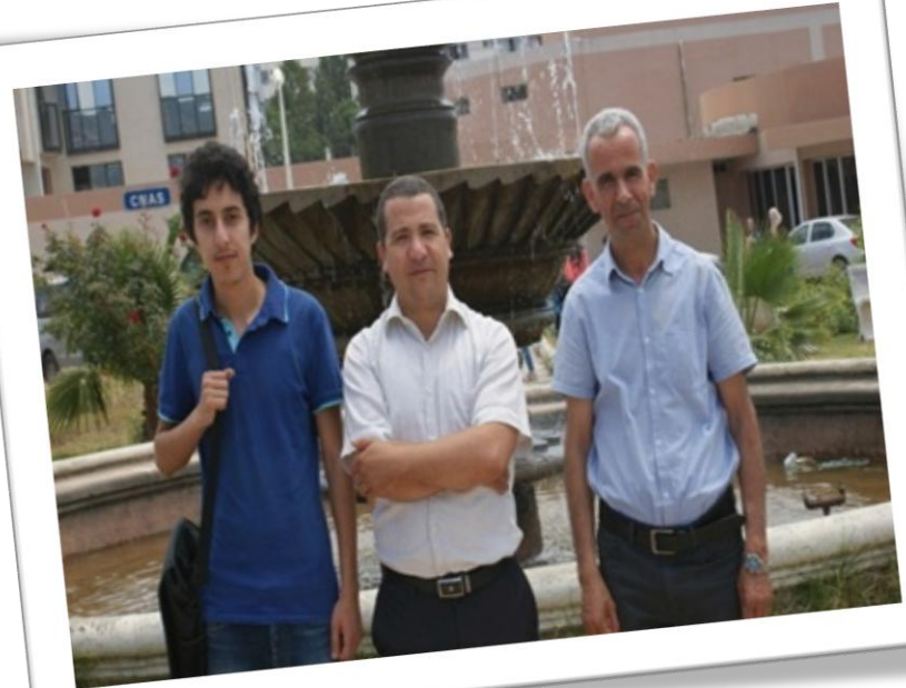
Candidats retenus dans le cadre du Programme UnetBA 2015/2016