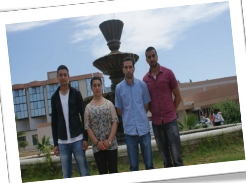
Candidats retenus dans le cadre du Programme BATTUTA 2015/2016