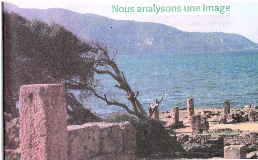
Les ruines romaines de Tipaza

Cette image apparaît dans la première séquence du premier projet du manuel. Elle représente un site archéologique qui est « Les ruines romaines de Tipaza », un beau paysage alliant la mer méditerranéenne et le mont de Chenoua, qui permet de combiner la découverte des ruines et une baignade sur la plage, sachant que Tipaza est un véritable pôle pour le tourisme. Visiter les ruines romaines en compagnie d'un guide permet d'enrichir les connaissances historiques et culturelles.