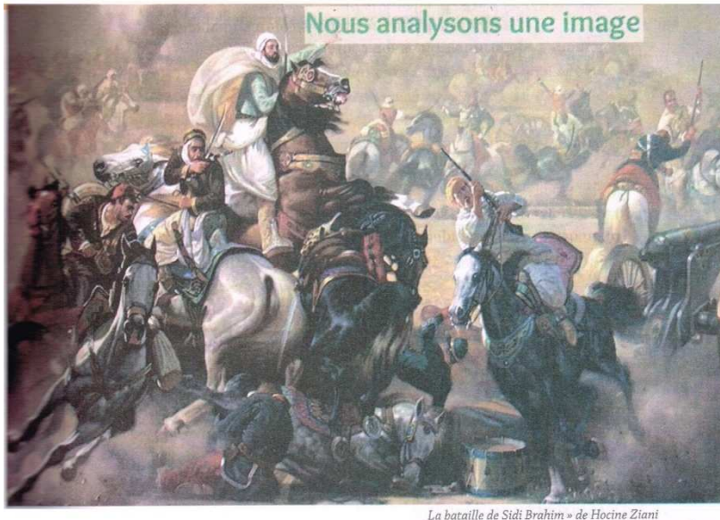
La bataille de Sidi Brahim » de Hocine Ziani

La toile intitulée « La bataille de Sidi Brahim » est représentée par l'artiste Plasticien Algérien « Hocine ZIANI ». Cette image est listée dans la deuxième séquence du premier projet du manuel.