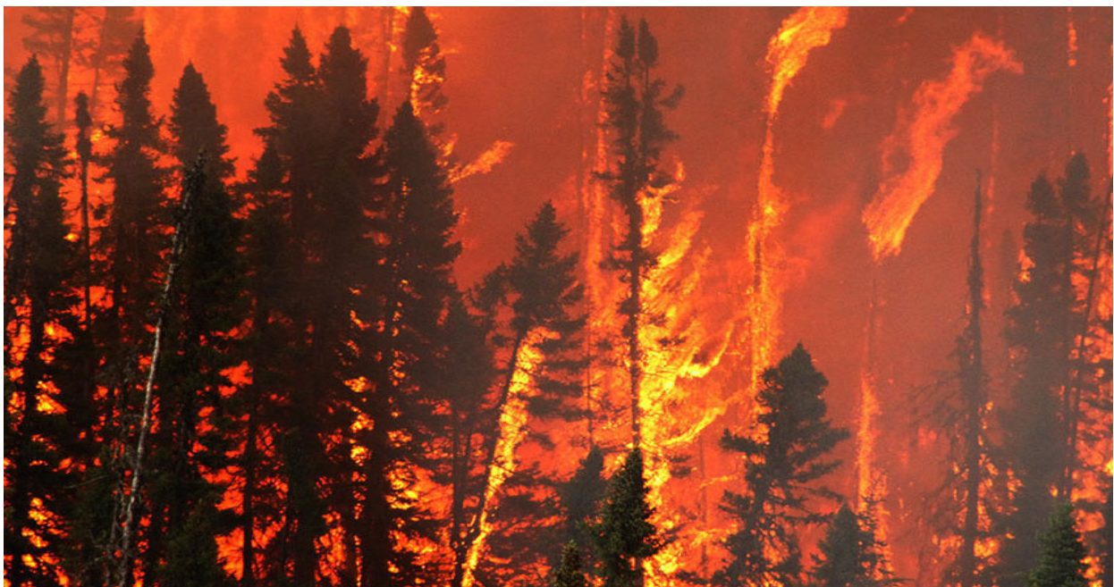
Figure 03 : feux de cimes

C) Feux de cimes : Les feux de cimes se propagent d'une façon rapide et entravent comme il se compose en deux types de feu de cimes : Le feu de Cime intermittent, où les arbres s'enflamment souvent mais pas en continu.