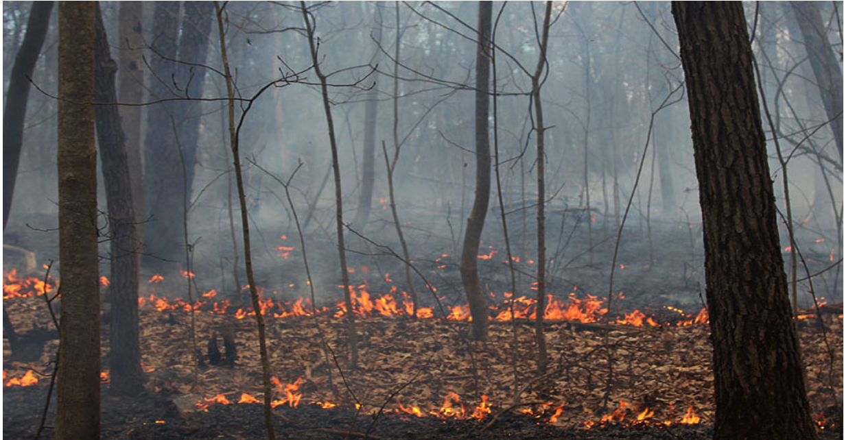
Figure 02 : feux de surface

B). Feux de surfaces : La surface est considéré la première basse de sol, mais le feu de surface brûle la couche de combustible de la surface, où de sol ce qui cause le problème de disparition des espèces animales et végétales dans les forêts, ce type de feu à une forte vitesse de propagation.