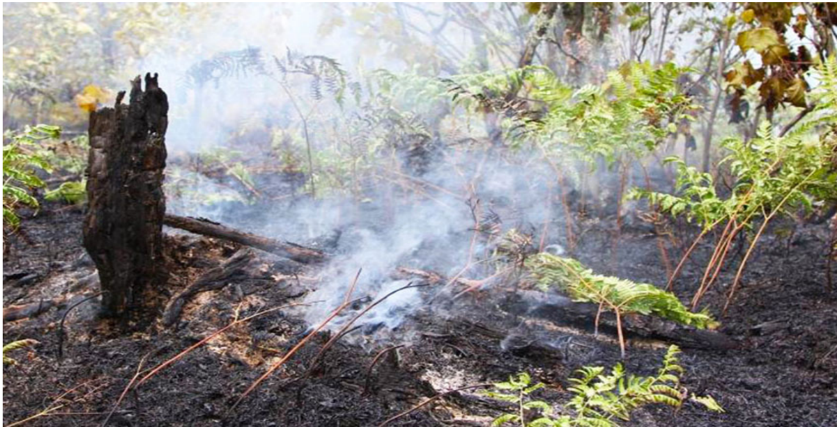
Figure 01 : feux de profondeur

Ce type brûle dans la matière organique, généralement ce type d'incendie est décrit comme rampant, brûle en matière organique, ces derniers ont une faible vitesse de propagation.