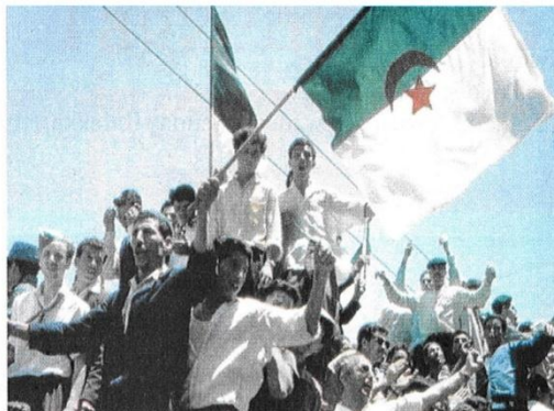
Tallit n tđrad