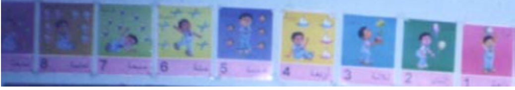
البطاقات والصور التعليمية