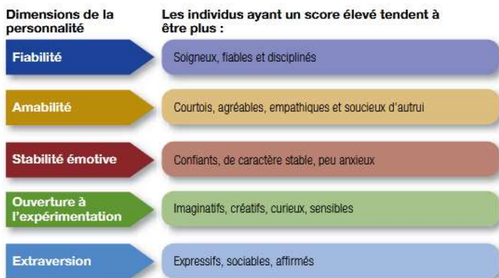
Figure 1 : dimensions du model de big- five de La personnalité

-Manque certains traits de personnalité comme l’humour, la manipulation ou l’idée de soi n’apparaissent pas