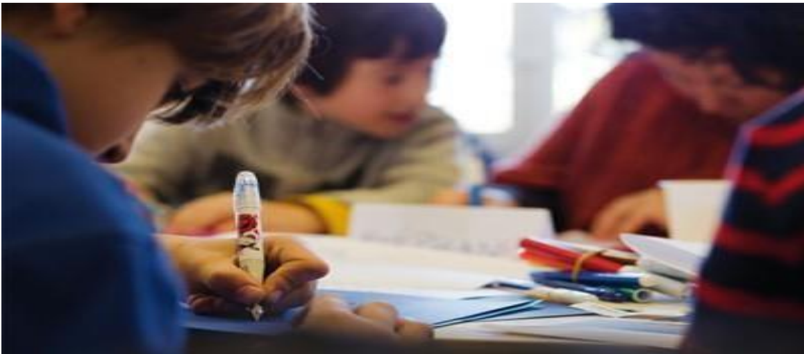
Tugna uť 3: Tuddsa n ugraw

Tuddsa n tneyrit: Deg yal tineyrit ad yili usakwen n tira anda ad arun yinelmaden tullisin-nsen, aselmad ad ibeddel i yimukan n ttwabel d tasqqaymut (tableronde) amek ad ilin yinelmaden zdin, syin ad yili netta d amesfađu n usakwen ad ten-iwelleh ma ssutren-d afus n talelt deg wayen ur gzin ara, yer taggara ad d-tili deg uyerbaz tyuri n tullisin akken ad walin yiselmaden anta i yfazen d tasnulfant.