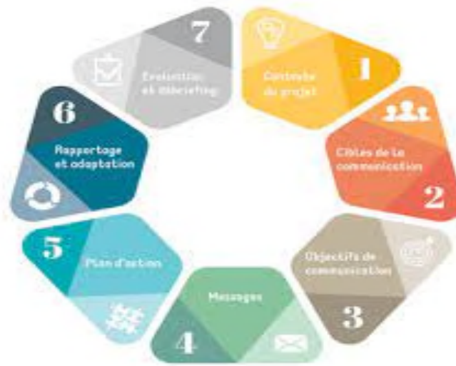
Figure III-1: Plan de communication

• A ('act' ou 'adjust') : agir, ajuster, réagir.