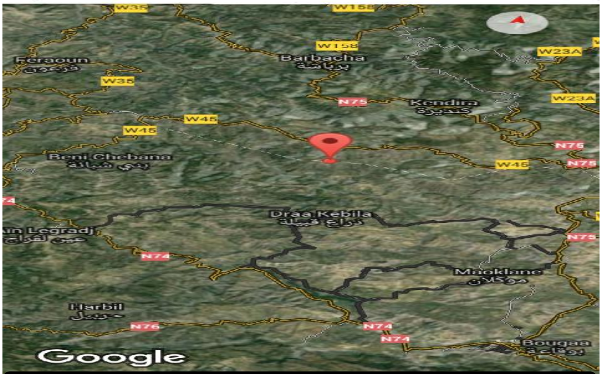
Takerđa n tyiwant n Busellam

Tugna-ya d tin i yerzan Tayiwant n Busellam, nekkes-itt-id seg Google Earth ( Google maps avec coordonnées 36°29'39''Nord 5°02'3''Est /36.49419, 5.04359 ).