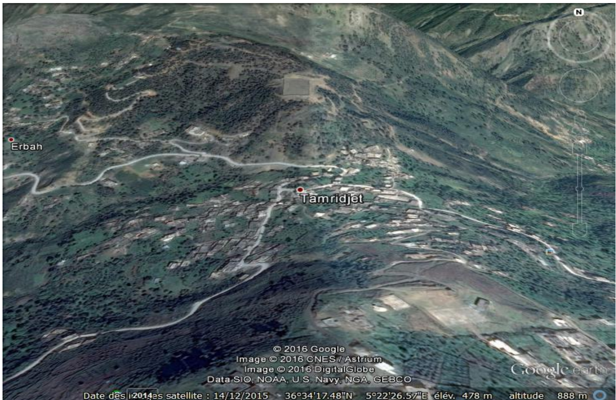
Takerđa n tyiwant n Temrijt

Tajuma n tyiwant n Temrijt tesša 53,27 n yikilumitren 2 . Ma deg wayen yerzan amđan n yimezday-is, d win yewđen yer 8371 deg useggas n 2008. Tugna-ya terza tamnađt n Temrijt, nekkes-itt-id seg Google Earth .