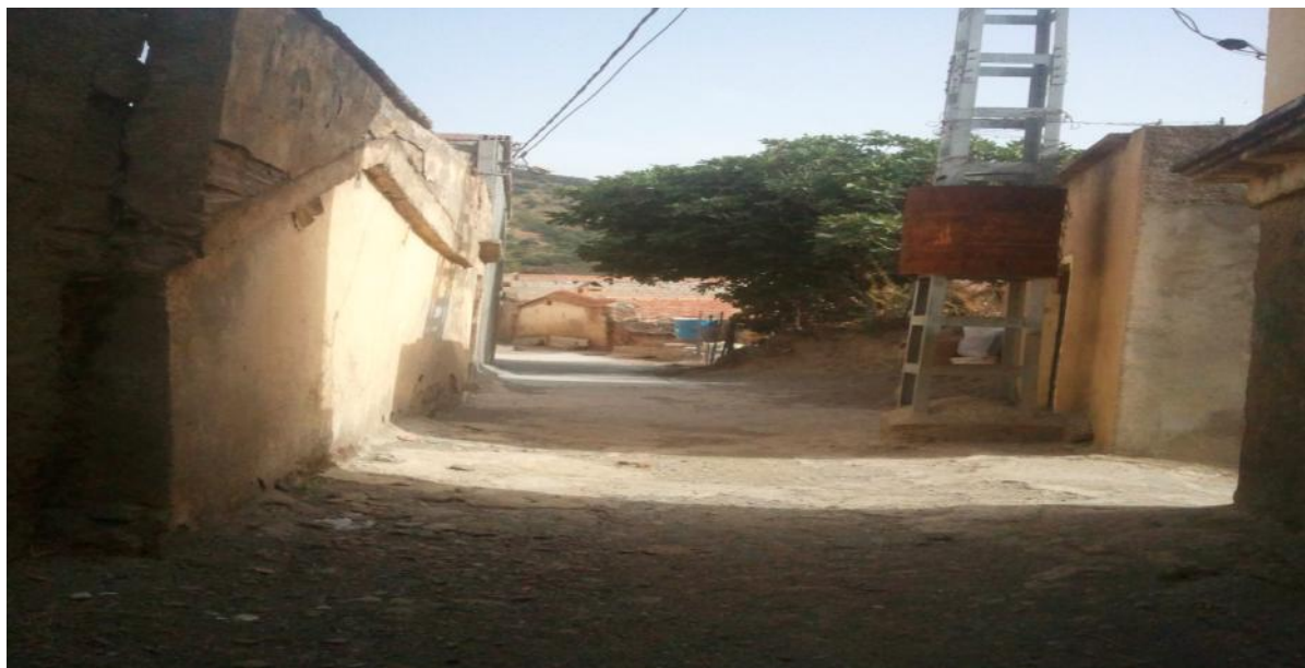
Tugna 14: A ric-nni en deg wadeg n tnezdu t n At U eddad.