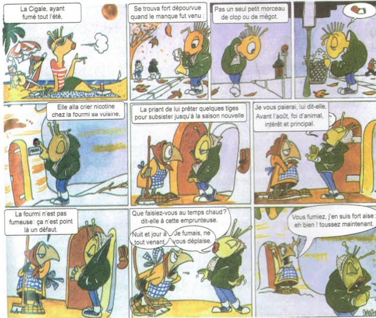
La Cigale le tabac et la fourmi, publicité anti-tabac par Delestre de la ligue nationale contre le cancer, 1991.