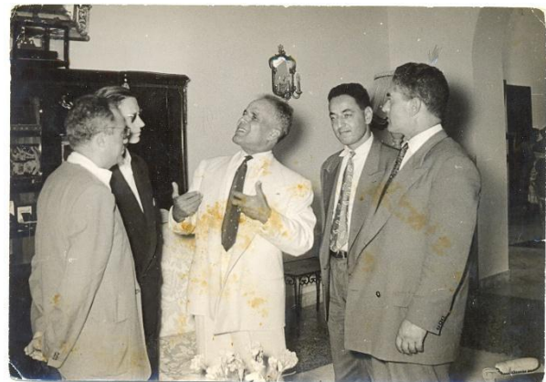
Figure 13 : Le Commandant Kaci en compagnie du président Bourguiba.