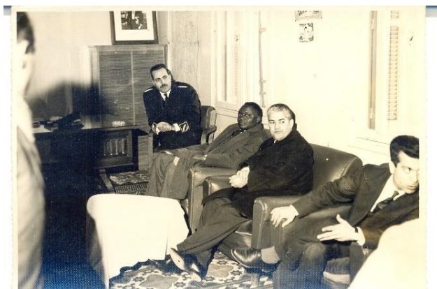
Figure 25 : Le Commandant Kaci en compagnie du Président guinéen Ahmed Sekou Touré, alors en visite officielle en Tunisie