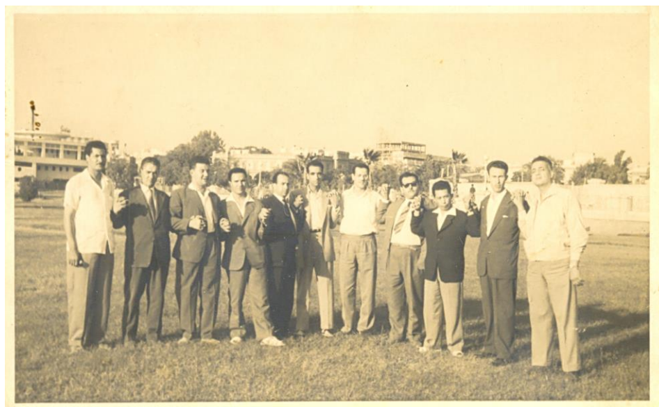
Figure 27 :En 1958 à la Conférence de Casablanca, en compagnie de Boussouf, Boumedienne, Krim, Ben Tobbal,...