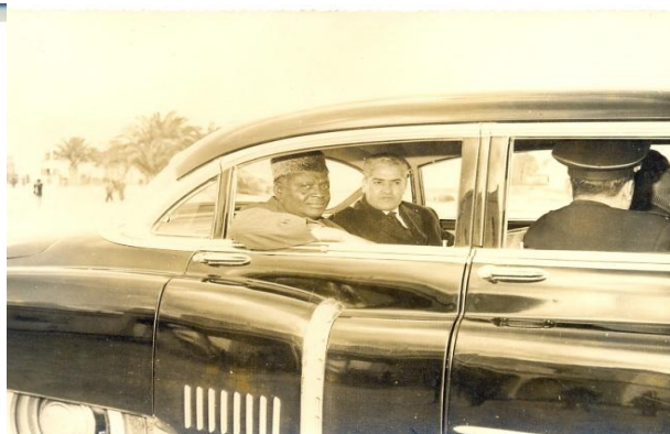
Figure 26 : Le Commandant Kaci en compagnie du Président guinéen Ahmed Sékou Touré, alors en visite officielle en Tunisie