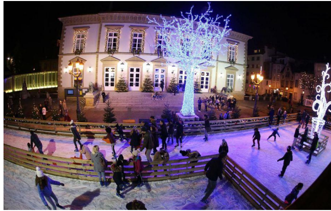
Figure 2 : L'accident s'est produit à quelques mètres de la patinoire (illustration).

Nous constatons que c'est une photo simple dans laquelle on montre le lieu et le monde présent durant l'accident.