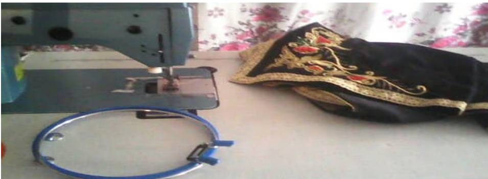
Tamacint n ubrudi d ħniber akked tqendurt I yemmugen s ubrudi