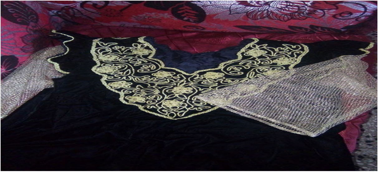
Taqendurt n lfergani tettwaæmmer s lħarġ