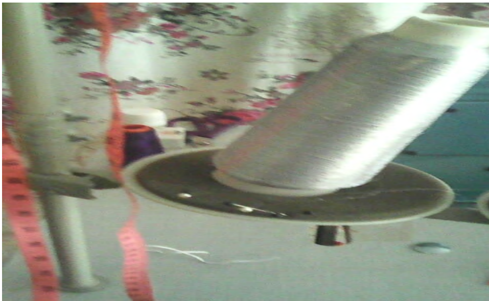
Tabunayt akked lmitra