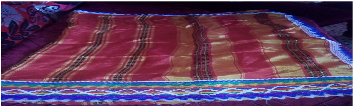
Lfuḍa temmug s tesfift n twaḍit akked zigzag