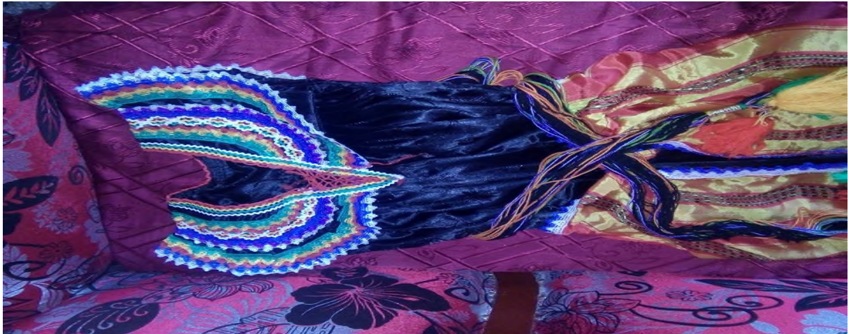
Takessiwt n twađit s waggus d lfuđa