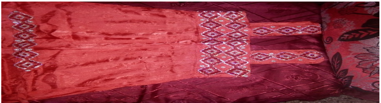
Taqendurt temmug s labrutal, yettwaxdem-as lgalu