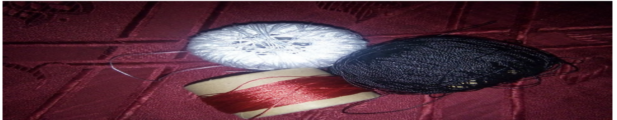
Tibunayin n lxiđ yemmug s leħrir, sexdamen-t deg ukruci