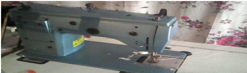
Tamacint n tegni d ubrudi