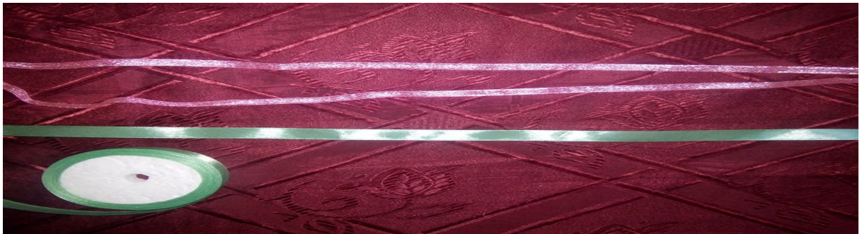
Lhaceyya tahrawant d terqaqt