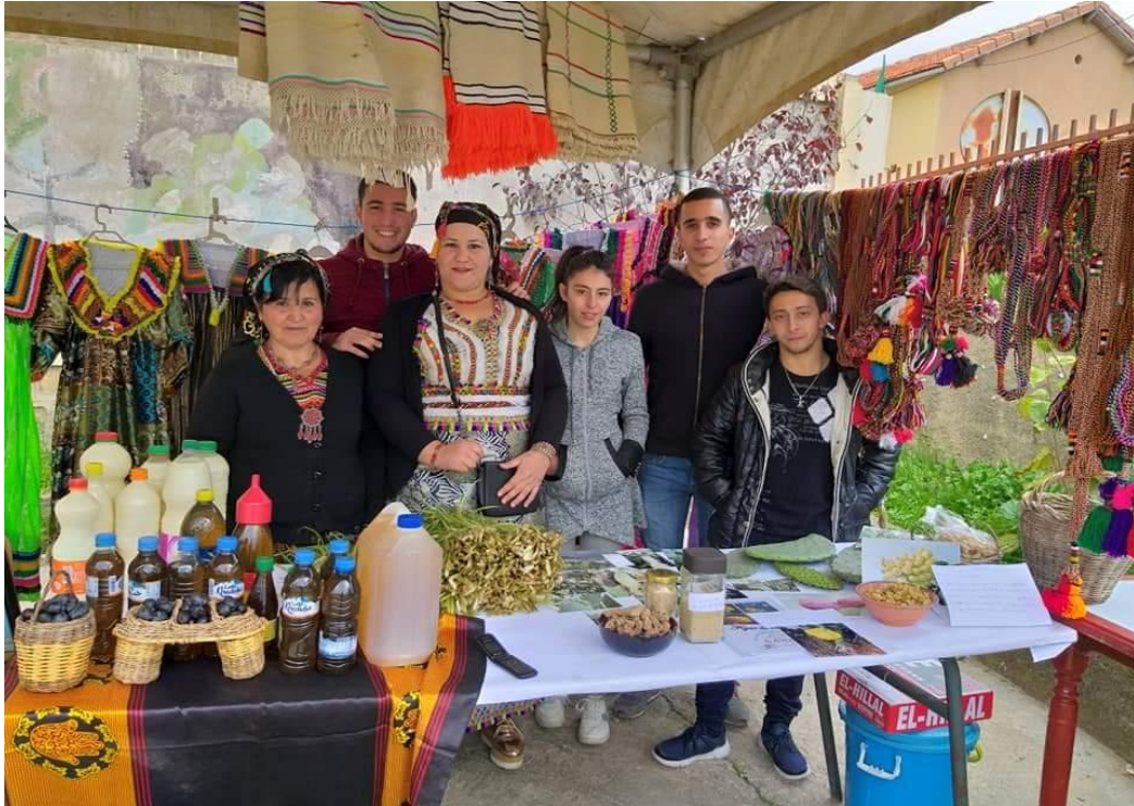
Image n°6 : l'exposition des produits d'aimantation au festival « AKARMUS ».