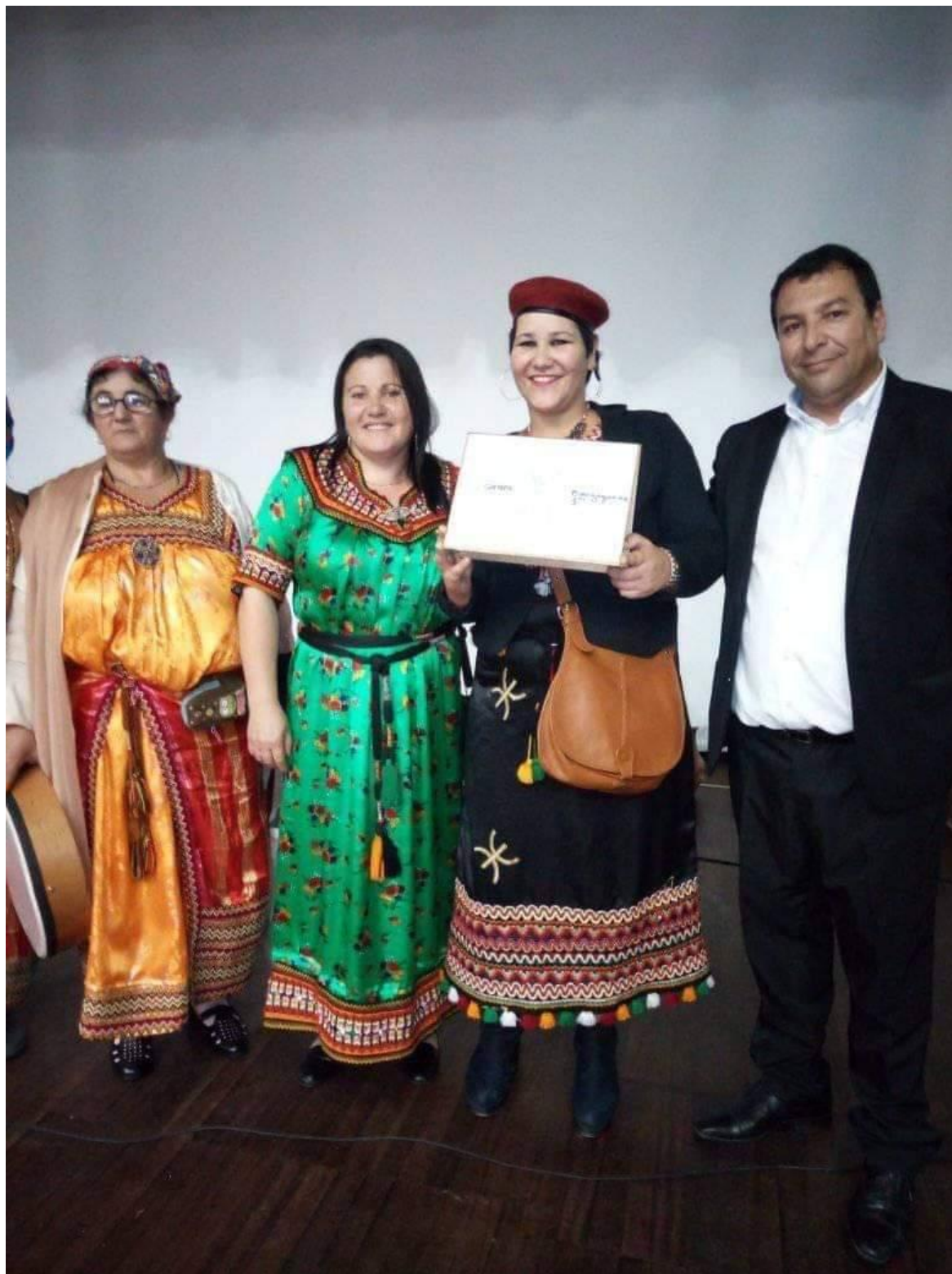
Image N°12: sa photo combine le président de comité de village et la présidente des femmes quand ils sont prend le premier prix de village le plus propre.