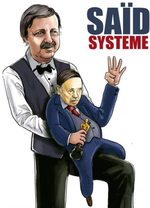
La caricature n°02

OSCAR DE LA MEILLEURE MANIPULATION POLITIQUE