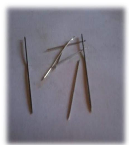
Allal : 04 : Tissegnit