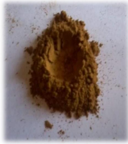
Allal : 02 : Lđenni