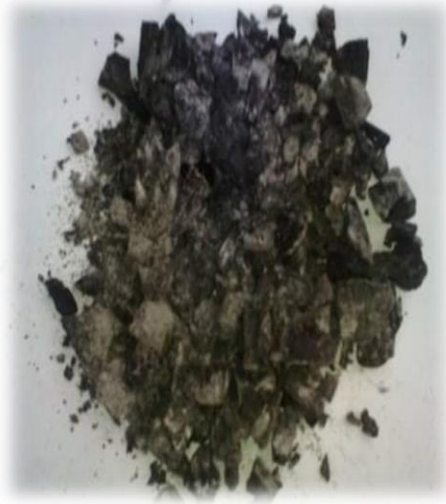
Allal : 01 : Tirgin