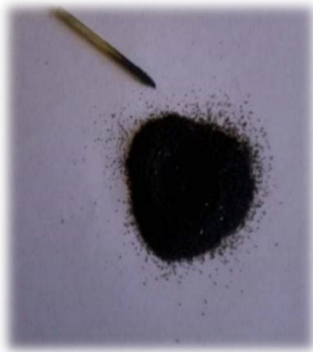
Allal : 03 : Lekđul