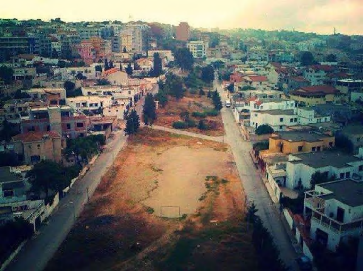
Figure 4-Photo du terrain.