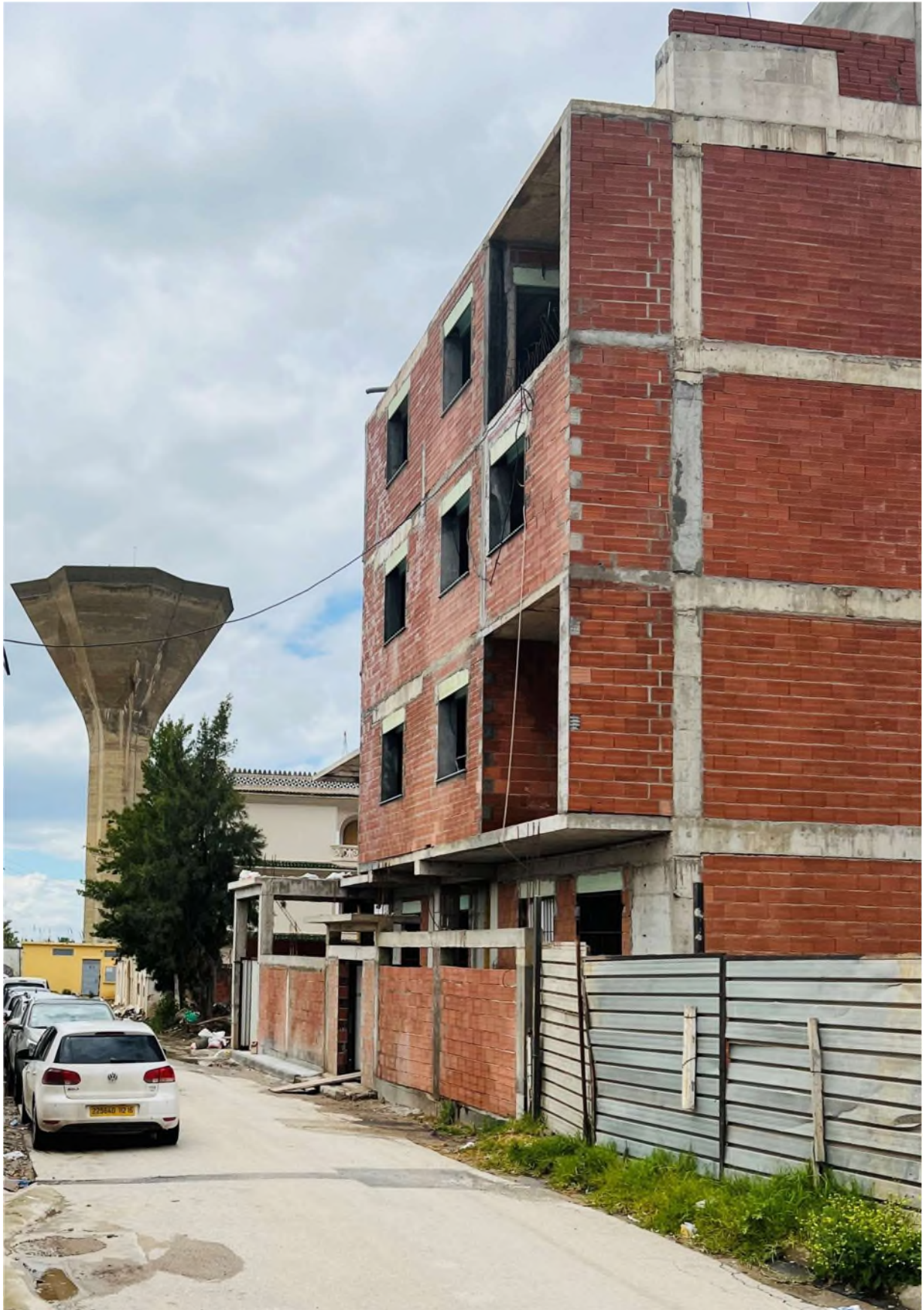
Figure 3-Photo prise par moi-même le 14/02/2022.