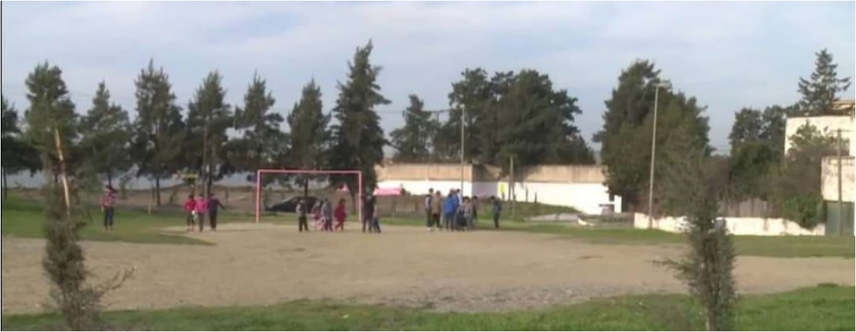
Figure 5-Photo du terrain.