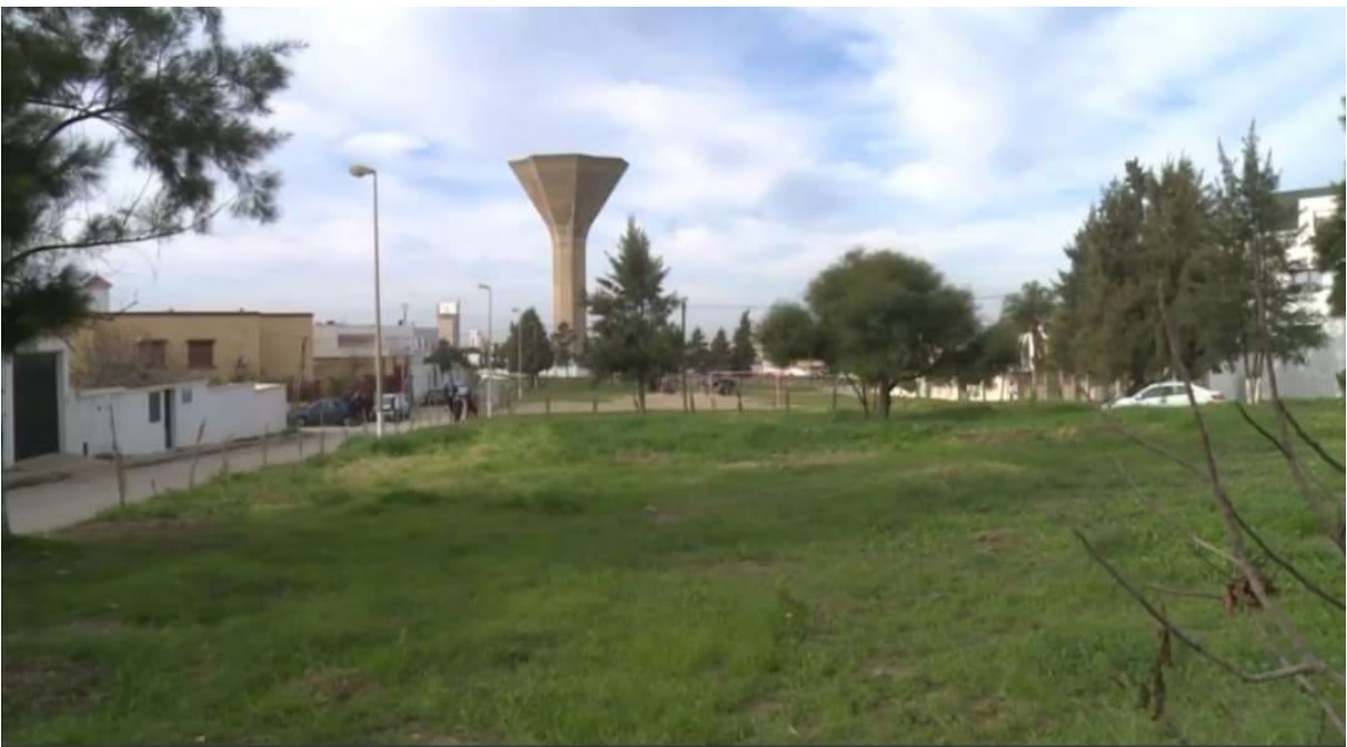
Figure 6-Photo du terrain.