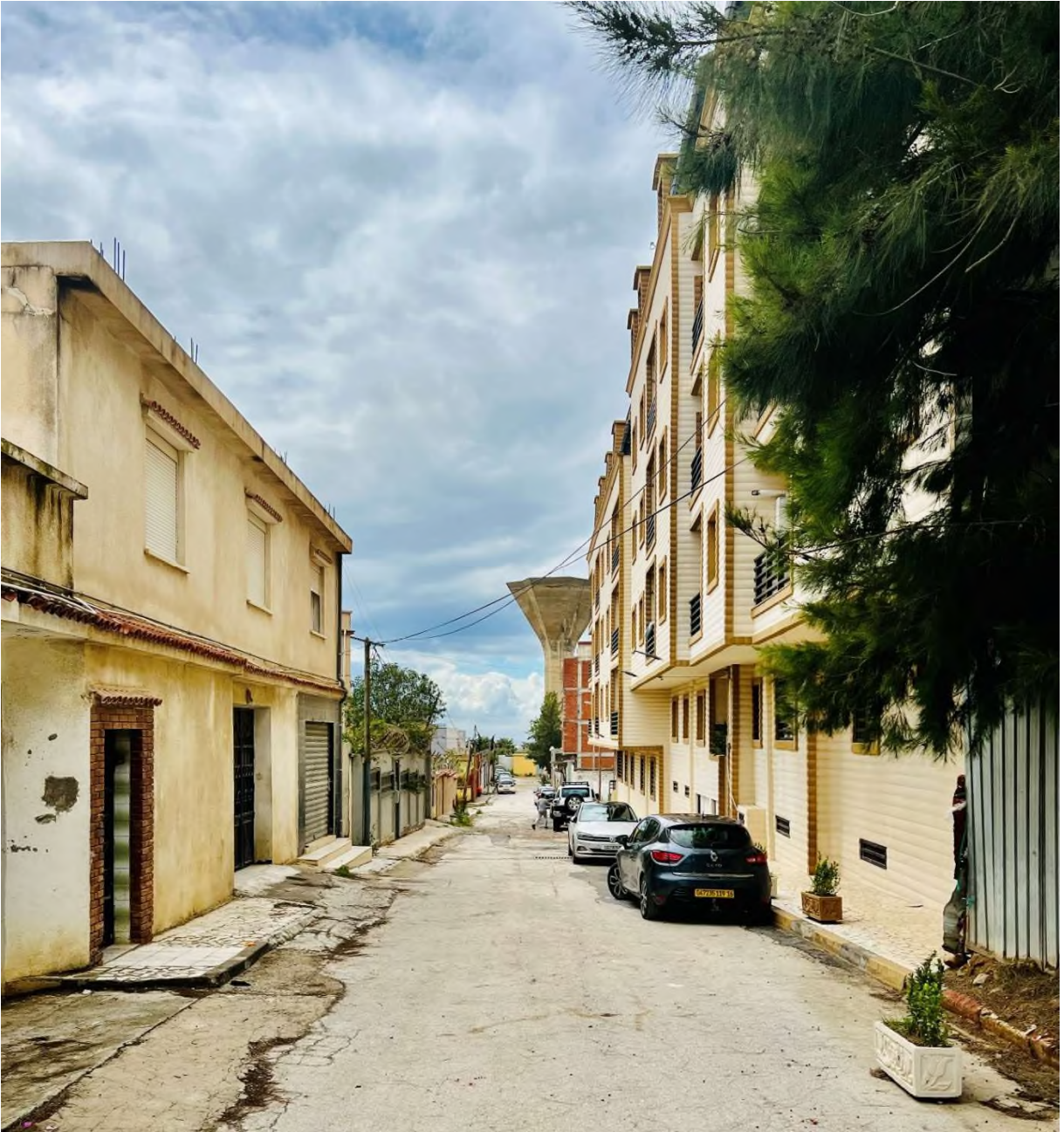
Figure 2-Photo prise par moi-même le 14/02/2022.