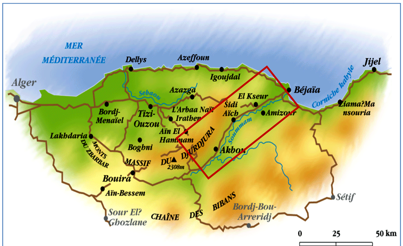
Carte 1 : Situation géographique de la zone d'étude.

La région d'étude, s'étend de la ville de Tazmal à l'Ouest jusqu'à la ville de Bejaia à l'Est, elle forme un couloir étroit et très allongé, sur une longueur d'environ 80 km et atteint jusqu'au 4 m de largeur. Elle est limitée au nord par la chaîne du Djurdjura, au sud par les montagnes des Bibans et Babors, à l'Est par la mer méditerranée, et à l'Ouest par le plateau de Bouira (Carte 1, page 1).